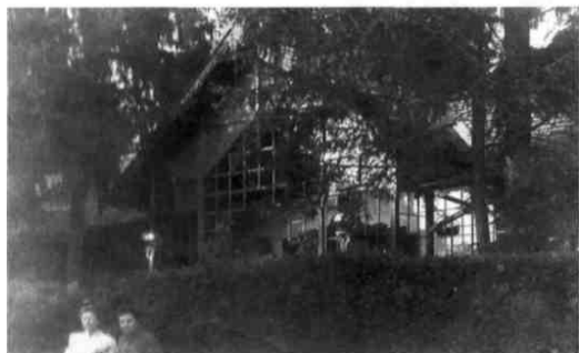
Aj takto kedysi vyzerala Vlčia dolina